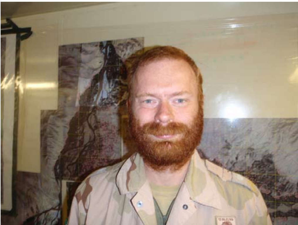
Ötzi, de Oostenrijkse ijsmummie uit de prehistorie