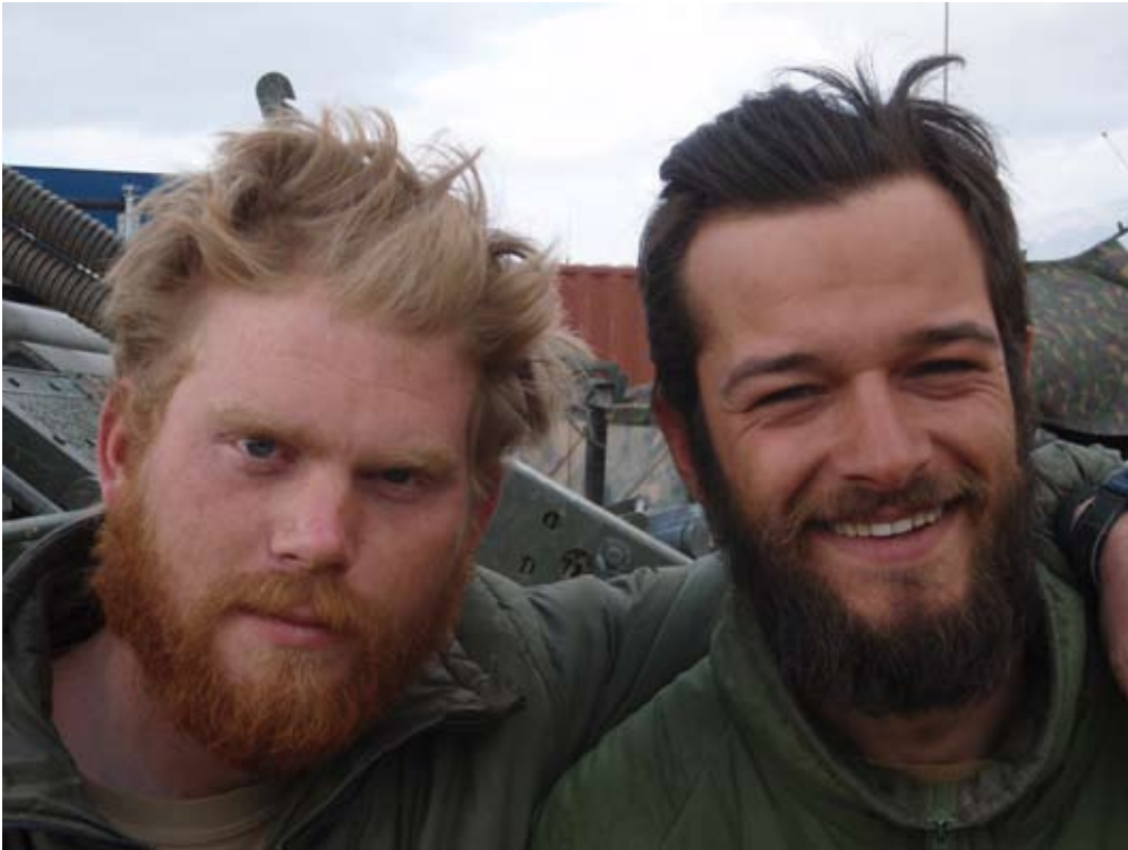
Lazy Donkey en Tanjiman

Voor de Baard van BG8 verkiezing zijn de inzendingen beperkt gebleven tot 2 foto's, maar dat zijn dan gelukkig wel meteen twee hele goeie inzendingen. Zoals beloofd, de uitslag volgt in Nederland!!!