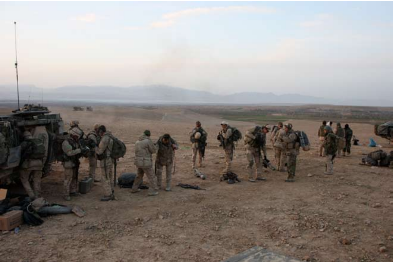
Prep voor een patrouille tijdens Towri Ghar

Zo gezegd, zo gedaan, maar toen de man verder naar zijn huis werd begeleid bleek de beste man de eigenaar te zijn van de quala met de verboden rommel die we hadden gevonden, dus bij aankomst daar had hij heel wat uit te leggen. Uiteindelijk is de oudste zoon van de man gevangen genomen, en zijn de verboden spullen in beslag genomen en afgevoerd. Daarna zijn we richting de overwatch afgebroken en konden we terugkijken op een hele geslaagde dag.