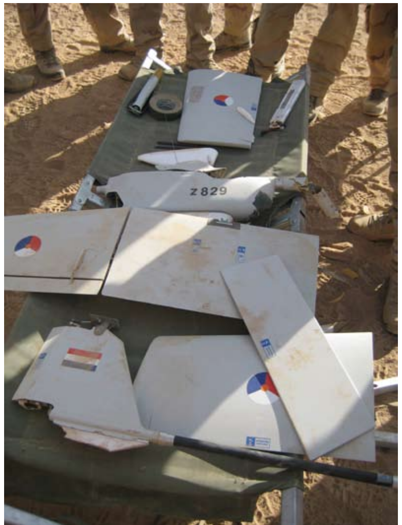
De treurige restanten van de Faladins